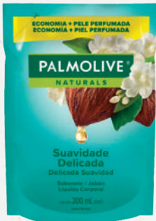
Sabonete Líquido Palmolive Refil 200ml - cada