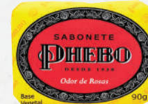
Sabonete Phebo 90g - cada