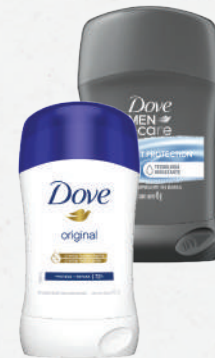
Desodorante Dove Stick 45g - cada