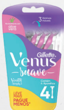
Aparelho Gillette Venus Simply 3 Embalagem Leve Mais Pague Menos 4 unidades - cada