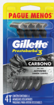
Aparelho Gillette Prestobarba 3 Embalagem Pague Menos 4 unidades - cada