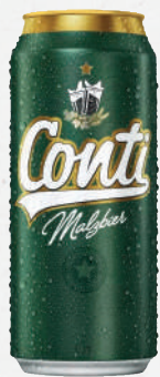
Cerveja Conti 473ml - cada 4,49