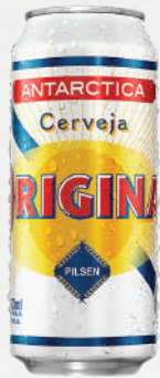
Cerveja Original 473ml - cada 4,99