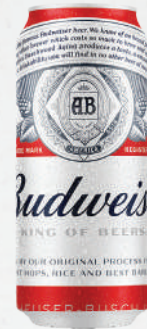
Cerveja Budweiser 473ml - cada 4,79