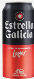
Cerveja Estrella Galicia 473ml - cada 5,69