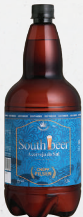
Chopp Southbeer Pilsen 1,5 litro - cada 10,49