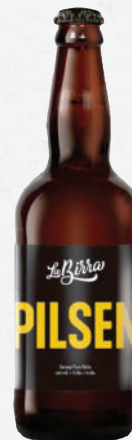
Cerveja La Birra Pilsen 500ml - cada 8,99