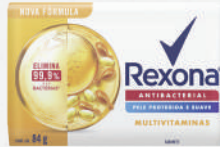
Sabonete Rexona 84g - cada