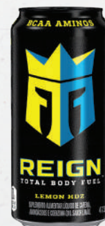
Suplemento Alimentar Reign 473ml - cada 5,99