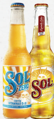
Cerveja Sol 330ml - cada 4,99