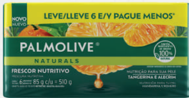
Sabonete Palmolive Embalagem Leve 6 Pague Menos 6x85g - cada