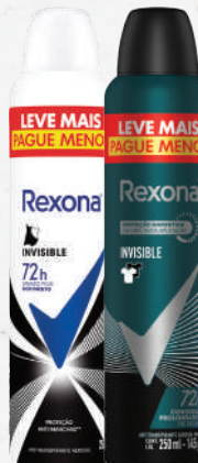
Desodorante Rexona Aerossol 250ml - cada