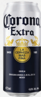
Cerveja Corona 473ml - cada 5,99