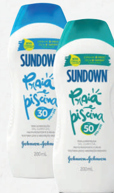
Protetor Solar Sundown FPS 50 200ml - cada