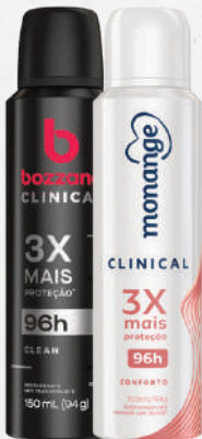
Desodorante Bozzano ou Monange Clinical Aerossol 150ml - cada