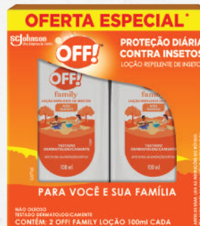
Kit Loção Repelente OFF! Family 2x100ml - cada