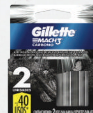
Lâmina Gillette Mach 3 2 unidades - cada