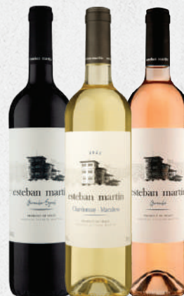
Vinho Esteban Martín 750ml - cada 32,90